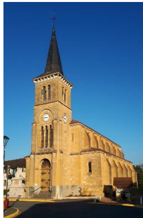
Clocher de 1904

Cette église néo-gothique est constituée par une nef de quatre travées, accostée de collatéraux, un transept non saillant et une abside semi-circulaire flanquée d'absidioles qui ouvrent sur les croisillons. Elle est voûtée d'ogives.