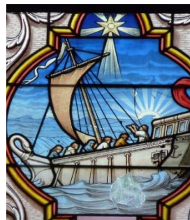
Etoile du matin