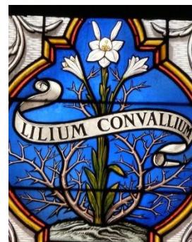
Lys des vallées

L'église Notre-Dame fait partie de la Paroisse Saint Lazare en Autunois qui compte 3 communes, dont le centre est Autun, siège de l'évêché d'Autun, Chalon et Mâcon, soit 16.147 habitants.