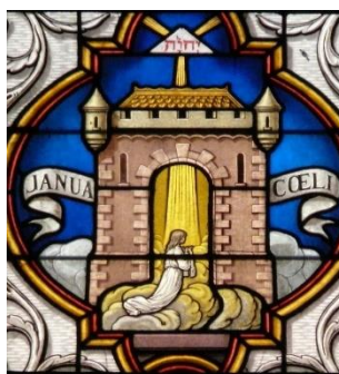
Porte du Ciel