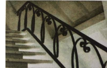
Escalier montant au clocher