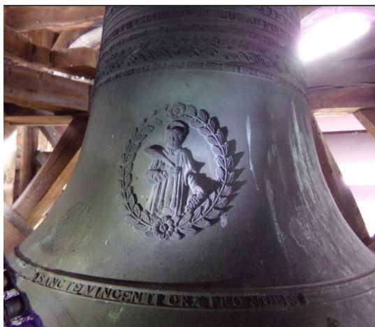
Cloche de 1871 à l'effigie de saint Vincent