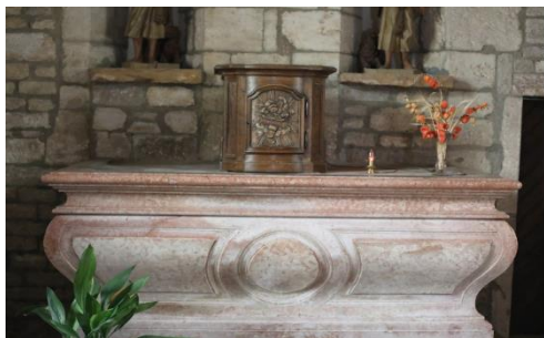
Maître-autel en marbre rose, XVIIIe, tabernacle

La nef est éclairée latéralement par deux fenêtres en cintre brisé. Une porte latérale se trouve, au Midi, entre les deux fenêtres. Tribune à l'entrée.