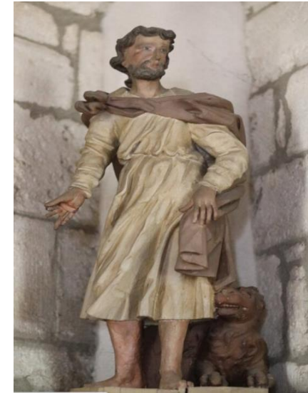
Statue baroque de Saint Marc avec le lion