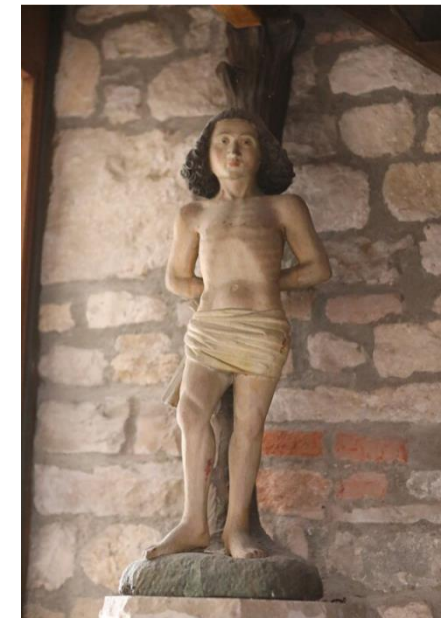
Statues de Saint Sébastien, XVIe, et d'un évêque, fin du Moyen Âge, bois peint, à l'entrée du chœur