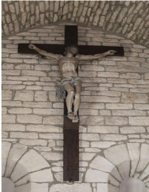
Christ en croix au fond du chœur