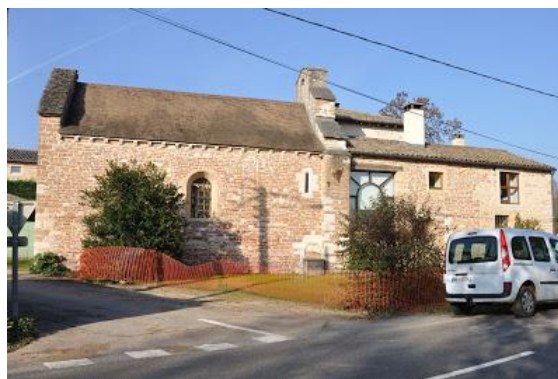
Ancienne église devenue chapelle privée

La nouvelle église, qui a repris le vocable de Saint-Bonnet, est construite aux Minets en 1856 et 1857 par l'architecte André Berthier, les travaux étant effectués après appel d'offres par l'entrepreneur Pierre Chelpozat de Clessé, qui se fera aider par l'entreprise Berthoud de Charbonnières : le 1 er octobre 1857, l'église est ouverte au culte. L'église est située en bordure de la D 103. » (Site de la Mairie, wikipedia)