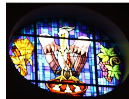
Vitrail du pélican, qui nourrit ses petits de sa propre chair, symbole du sacrifice eucharistique du Christ, avec la vigne et le blé.