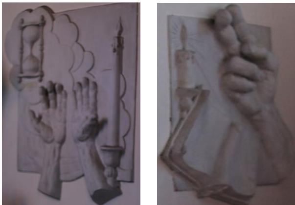
Suite de bas-relief décoratifs (1 et 2)