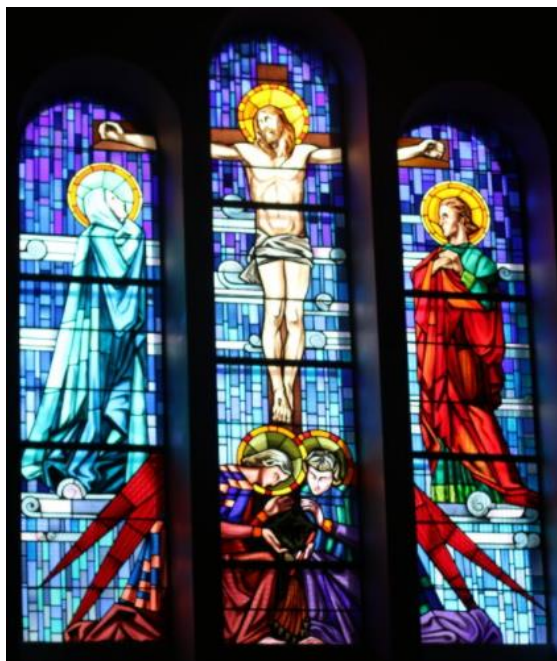
Vitrail axial de la Crucifixion du Christ entouré de la Vierge et de saint Jean

l'aménagement du chœur et à l'installation de l'éclairage.