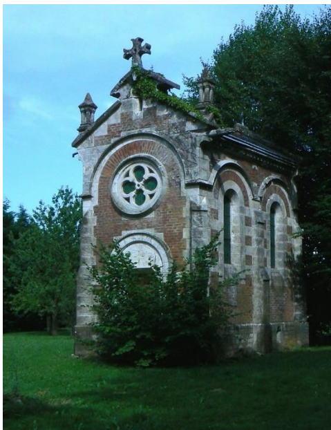
Chapelle du château de Frontenaud

Frontenaud était autrefois un village de tradition d'eau et comptait vers 1856 sept moulins alimentés par la Gizia, la Dourlande et le bief de l'étang d'Essart. Le moulin du Venay sur la Gizia est encore bien conservé.