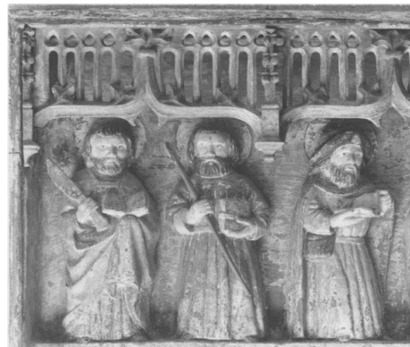
St Barthélémy (couteau), st Thomas (lance), st Jacques le Majeur (coquille)