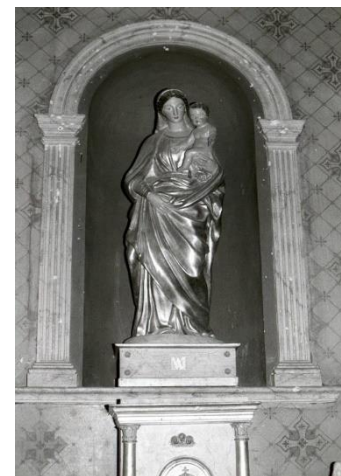
A l'ouest du collatéral nord, un autel avec tabernacle en bois peint de type néo-classique. Dans la niche supérieure, Vierge en bois peint, dorée à la feuille, datant du XIX e siècle.

représentent Saint Pierre et Saint Augustin signés en 1864 par le maître-verrier Pagnon-Déchelette de Lyon. On peut admirer les vitraux de la nef, dons de particuliers.