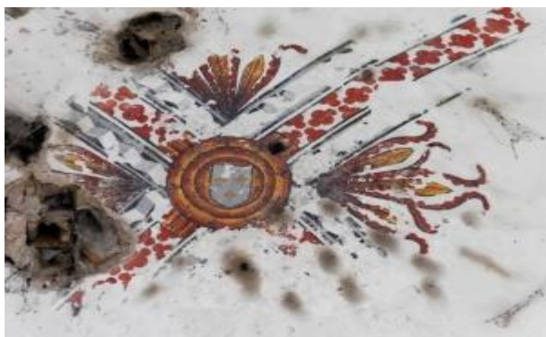
Clef de voûte peinte à la croisée des arcs

L'église paroissiale de l'Assomption de Lournand était anciennement sous le vocable de Sainte-Marie. Un premier édifice est mentionné en ce lieu dès le X e siècle dans une charte de Cluny. On retrouve mention de l'église au début du XII e siècle, lorsqu'elle est rendue au chapitre de Saint-Vincent de Mâcon. De l'époque romane, il subsiste aujourd'hui la travée sous clocher, voûtée d'une coupole octogonale sur trompes, délimitée par quatre arcs en plein cintre.