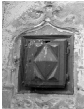
A gauche de la porte, subsiste une armoire eucharistique (qui a été martelée) de style gothique flamboyant, ornée d'une porte Louis XIII.

L'église est bâtie sur un plan basilical, de type néo-roman.