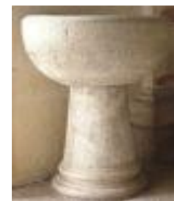
Près de la porte latérale, un bénitier ovale sur pied en pierre.

Au-dessus un tableau représentant l'Assomption de la Vierge. A l'est du collatéral sud, un autel sensiblement identique à celui du collatéral nord, sans tabernacle.