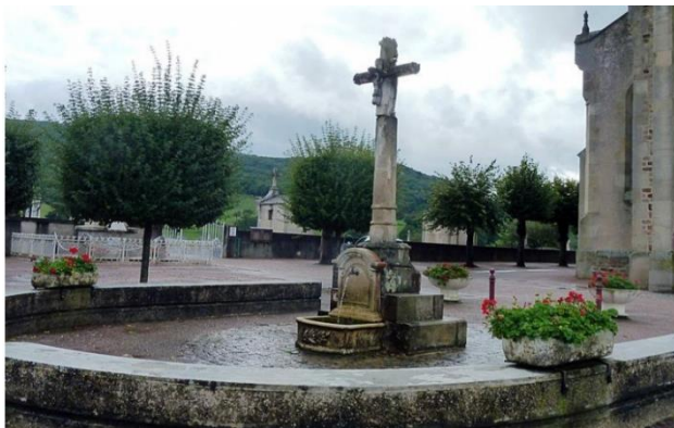
Calvaire gothique de l'ancien cimetière

Saint Martin est né en Pannonie, l'actuelle Hongrie, sur les frontières de l'empire romain où son père était en garnison. A 15 ans, il est soldat car la loi romaine obligeait les fils de soldats à s'enrôler dans l'armée. Il est muté en Gaule et c'est là, qu'à Amiens, il rencontre le pauvre grelottant à qui il donne son manteau et dont il apprend durant la nuit que c'est le Christ qui lui a fait cette demande. Il hésitait à devenir chrétien, il s'y décide enfin. Il quitte l'armée pour rejoindre saint Hilaire à Poitiers. Avec lui, il fonde le premier monastère des Gaules, à Ligugé, en Poitou. C'est là qu'il sera enlevé par les habitants de Tours qui en font leur évêque. Mais l'ancien soldat devenu chrétien ne s'enfermera pas dans sa cité. Il évangélisera parcourant les campagnes jusqu'à sa mort, à Candes, en 397, sur les bords de Loire, disant : "Seigneur, s'il le faut, garde-moi en vie, car je ne refuse pas le labeur." www.nominis.fr Plus de 50 églises sont dédiées à Saint-Martin en Saône-et-Loire.