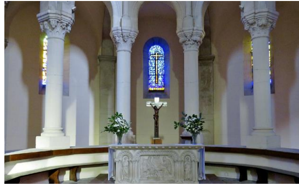
Maître-autel néo-gothique et déambulatoire

arcades en plein cintre du sanctuaire retombent sur des colonnes rondes surmontées de chapiteaux à crochets.