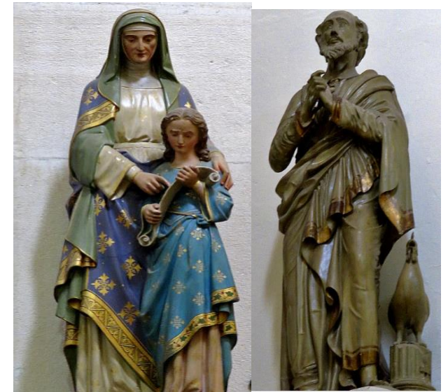
Statue de Sainte Anne éduquant Marie et de Saint Pierre (avec le coq) après son reniement