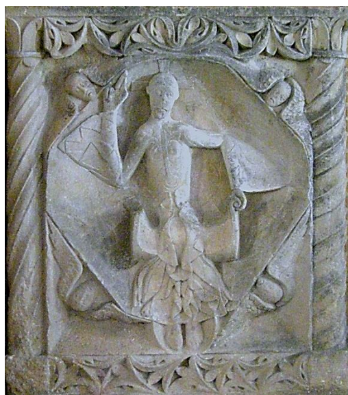
Christ en Gloire roman de Saint-Amour-Bellevue

Passant le long de la mer de Galilée, Jésus vit Simon (Pierre) et André, le frère de Simon, en train de jeter les filets dans la mer, car c'étaient des pêcheurs. Il leur dit : « Venez à ma suite. Je vous ferai devenir pêcheurs d'hommes. » Aussitôt, laissant leurs filets, ils le suivirent. Jésus avança un peu et il vit Jacques, fils de Zébédée, et son frère Jean, qui étaient dans la barque et réparaient les filets. Aussitôt, Jésus les appela. Alors, laissant dans la barque leur père Zébédée avec ses ouvriers, ils partirent à sa suite. Marc 1, 16-20