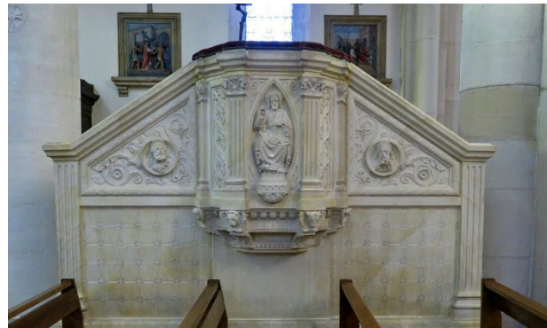
Chaire à prêcher néo-gothique avec Christ enseignant

Le fond de chaque croisillon est décoré de trois grands tableaux : - au nord : le Baptême du Christ ; - au sud : la Vierge en Gloire avec deux saints agenouillés dont un dominicain ; un saint ermite ; la Sainte Famille. Dans le croisillon nord est apposée une plaque des noms des principaux bienfaiteurs de la paroisse, à gauche de l'autel néo-gothique de la Vierge présentant son Fils au monde. Le devant d'autel représente une Annonciation.