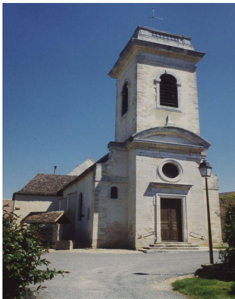
Façade occidentale néo-classique

Mais toi, en toute chose garde la mesure, supporte la souffrance, fais ton travail d'évangéliste, accomplis jusqu'au bout ton ministère. Moi, en effet, je suis déjà offert en sacrifice, le moment de mon départ est venu. J'ai mené le bon combat, j'ai achevé ma course, j'ai gardé la foi. Je n'ai plus qu'à recevoir la couronne de la justice 2 e lettre de Saint Paul Apôtre à Timothée 4, 5-8