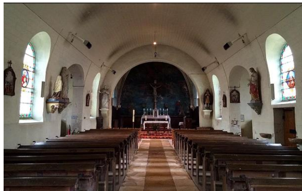
Vue intérieure de l'église Saint-Cyr et Sainte-Julitte

L'église a été bâtie à la fin du XV e siècle, il ne reste que le chœur couvert d'une voûte sur croisée d'ogives. Au XVIII e siècle, reconstruction de la nef, flanquée de deux chapelles ; construction d'une tour de clocher-porche et décor du chœur par une peinture murale. Au XIX e siècle, en 1988, reconstruction de la fausse voûte en plein cintre de la nef. En 1998, réfection des façades.