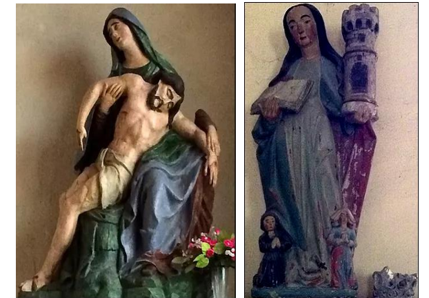
Pietà - XVIII e siècle