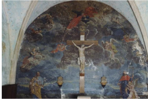
Le Christ en croix entre saint Roch et saint Joseph

L'église a été remaniée à plusieurs reprises et les divers intervenants ont même laissé des dates inscrites sur un pilier (14XX), à la base du clocher (1784) et sur la peinture du chœur (1735), fortement ruinée et signée d'un certain Defauze.