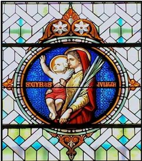
Vitrail de saint Cyr et sainte Julitte

Saint-Cyr était un très jeune garçon de 4 ou 5 ans vivant avec sa mère, Julitte, au IV e siècle, à Tarse (actuelle Turquie). Lors d'un procès public contre les chrétiens, il se faufila dans la foule et vint crier devant le juge qu'il faisait partie de cette communauté. Il s'en suivit une bousculade pendant laquelle Cyr continuait à courir partout en criant " Je suis chrétien ". Enervé, le juge finit par l'attraper et lui fracassa la tête contre un mur. Sa mère fut ensuite martyrisée. La tradition veut que les cendres du petit saint aient été amenées à Nevers par l'évêque saint Amateur.