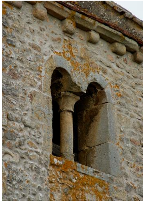
Baie géminée du clocher roman