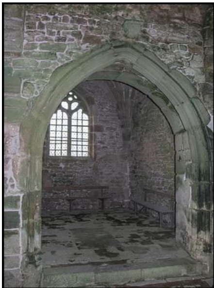
Chapelle gothique (entrée en arc brisé)