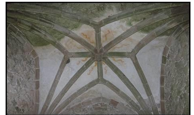
Voûte gothique sur croisée d'ogives

Le clocher est flanqué de deux chapelles saillantes carrées voûtées d'ogives avec quelques éléments de sculptures gothiques : petit masque, nervures et fenêtre à remplages permettant de les dater du XIVe siècle.