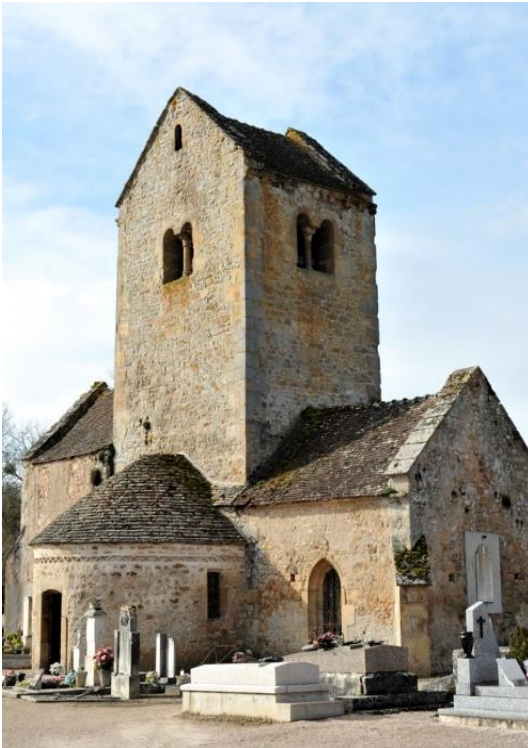
Clocher roman à toiture en bâtière

Des modifications de l'époque gothique sont visibles au niveau des fenêtres. La chapelle est inscrite à l'Inventaire supplémentaire des Monuments Historiques en 1958.