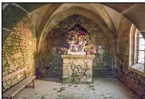
Pietà (1884) aujourd'hui