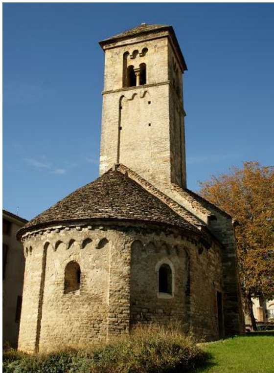
A proximité : Carmel Saint-Joseph