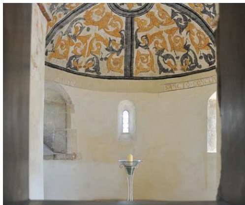
Chœur roman du XIIe siècle

A l'intérieur, le chœur se termine en cul-de-four. Il est orné de peintures murales à décor de rinceaux ocre et gris.