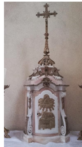
Sur l'autel latéral de droite, tabernacle en bois peint et doré du début du XIX e siècle. La porte du tabernacle est ornée du motif iconographique de l'Agneau couché sur le livre scellé de 7 sceaux de l'Apocalypse, ch. 5, 1-14.

Peinture sur bois dans le chœur, H 1,06 m x L 1,21 m, de facture italienne, du XVIII e siècle, représentant la Nativité et l'Adoration des Bergers , avec un blason de 3 bandes d'or sur champ d'azur surmonté d'un cimier, dans le coin inférieur gauche.