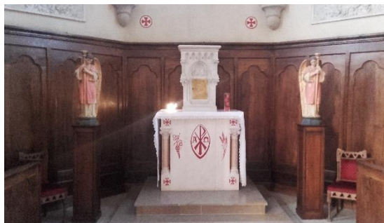
Autel du Saint-Sacrement orné du chrisme, au fond du chœur