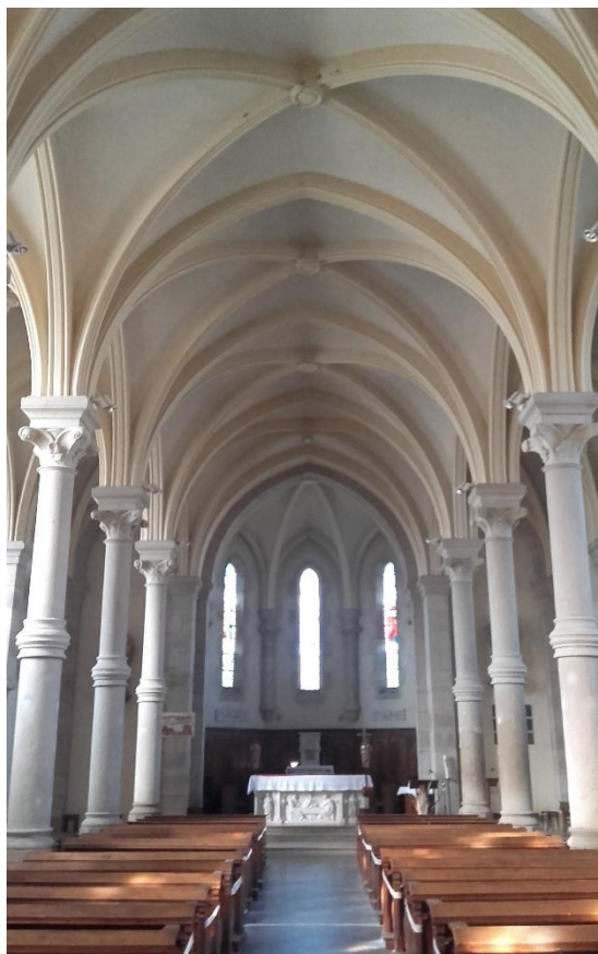
Voûtes d'ogives et 12 colonnes cylindriques Le maître-autel blanc est décoré des Pèlerins d'Emmaüs (Luc 24, 13-35).

L'abside, qui est soutenue par 6 colonnes à chapiteaux, prolonge la nef centrale et en continue les dispositions intérieures ; elle est percée de 5 baies comme celles des nefs. La sacristie est placée à l'angle de l'un des transepts. La pierre de taille a été prise aux carrières situées sur le versant de la montagne d'Antully au-dessus de Marmagne (grès fermé et dur).