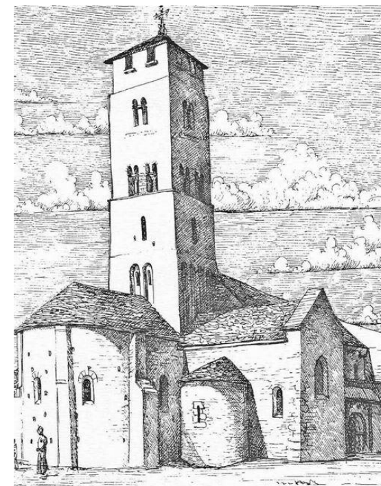
Dessin de Michel Bouillot