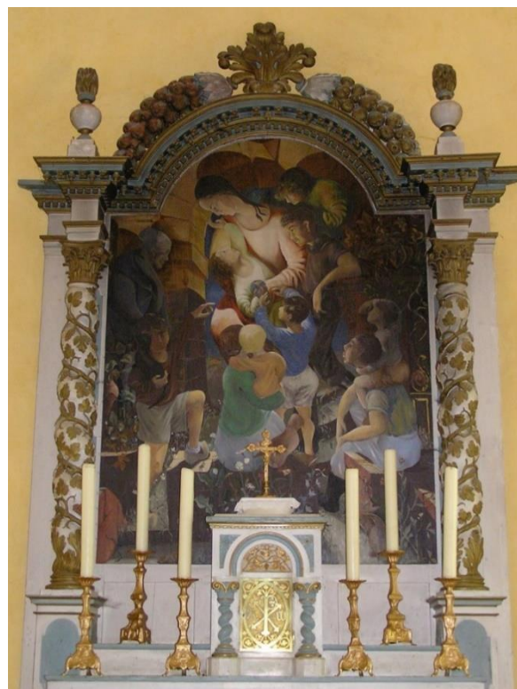
Peinture de la Sainte Famille Michel Bouillot

Dans le chœur , on distingue, obturée, une ouverture d'époque romane ; deux autres ont été partiellement « mangées » par les deux fenêtres du chœur plus récentes. Les vitraux des grandes fenêtres, en partie du XVII e siècle, sont à décor à bornes (hexagonaux).