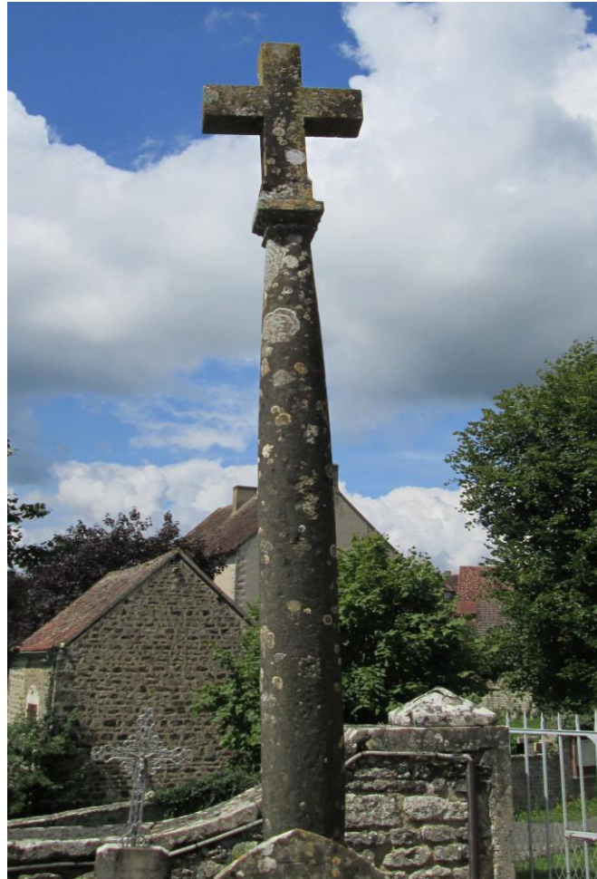
2. Croix du cimetière (1771) de Burzy. Croix cylindrique galbée, dressée sur un socle, elle porte la croix de section carrée et domine les sépultures, en signe d'Espérance chrétienne et de Résurrection. Elle porte la date de 1771, devant, et l'inscription, à gauche : « O crux ave spes unica » ( O croix, unique espérance ), 1er vers de la 6e strophe de l'hymne latine en l'honneur de la Sainte-Croix, « Vexilla Regis », attribuée à Venance Fortunat, évêque de Poitiers au VIe siècle.