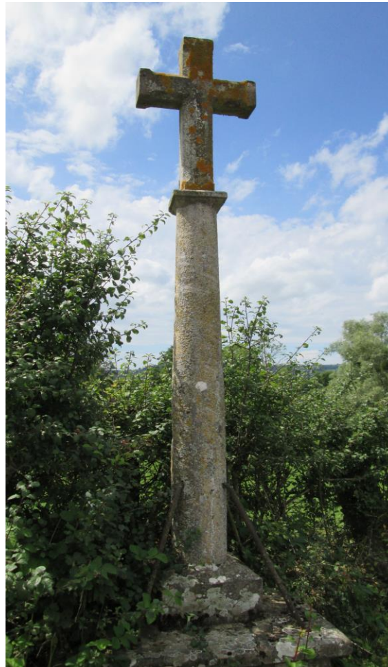
5. Croix de carrefour du Pré de la Barrière (1858), en pierre, sur la route de Burzy à Saint Huruge, soutenue par quatre fers. Le piédestal porte l'inscription « Je vous salue, ô Croix, mon unique espérance » et la date de 1858.