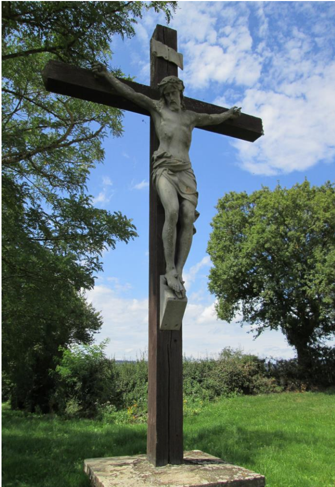
1. Calvaire de carrefour de la Condemine, à l'entrée de Burzy, au croisement avec Saint Huruge : croix de bois avec le titulus (titre) INRI sur un gros socle de pierre rejointoyées. Le Christ en croix avec la couronne d'épines est représenté avec réalisme dans un métal clair. Sa tête est inclinée, ses yeux sont fermés. Il porte des cheveux longs, la barbe et la moustache. Ses hanches sont ceintes du perizonium ; ses pieds superposés portent chacun un clou et reposent sur un support. Un repère IGN est logé à l'arrière.