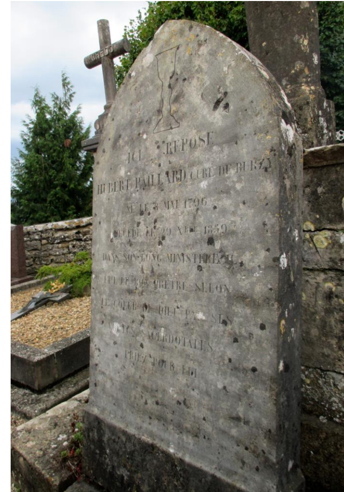
3. Pierre tombale adossée à la croix de cimetière.

Croix ornée d'un calice, avec l'épithaphe : « Ici repose Hubert Paillard curé de Burzy né le 8 mai 1796 décédé le 29 Xbre 1859 dans son long ministère il fut le bon prêtre selon le cœur de Dieu par ses vertus sacerdotales Priez pour lui ».