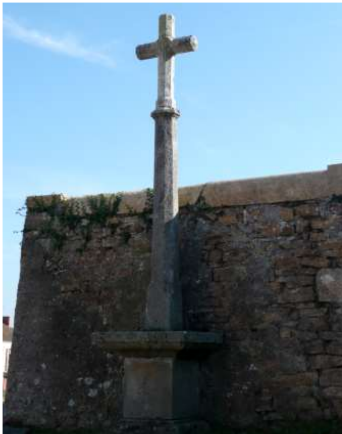
1. Croix de la Condemine , située en bas du raidillon qui monte à l'hôpital, à Charolles . Croix de pierre, sans inscription, ornée d'un cercle de pierre au croisillon gravé du monogramme JHS (Jesus Salvator Hominum = Jésus Sauveur des Hommes).