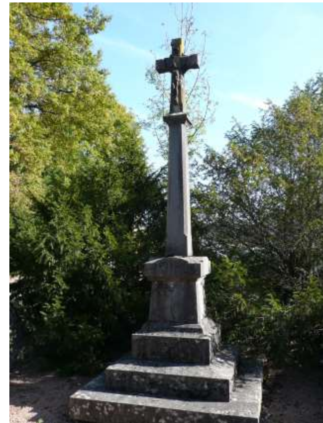
3. Croix de l'Avenue Joanny Furtin, sur la D168, à Charolles (à l'extrémité de l'ancienne avenue de la Gare). Croix de pierre à triple emmarchement qui évoque la Montée au Calvaire. Le Christ en Croix, vêtu d'un court perizonium, regarde vers le Ciel ; ses bras sont très élevés et ses pieds accolés. La belle ligne de fuselage du fût donne à l'ensemble un élégant mouvement ascensionnel. On ne lit aucune inscription sur le piédestal.