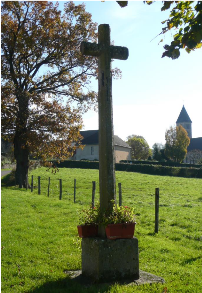
1. Croix à l'entrée du bourg de Marcilly-la-Gueurce, avec une inscription qui n'est plus lisible.

Croix monolithe octogonale renforcée par une attache, érigée sur un socle carré.