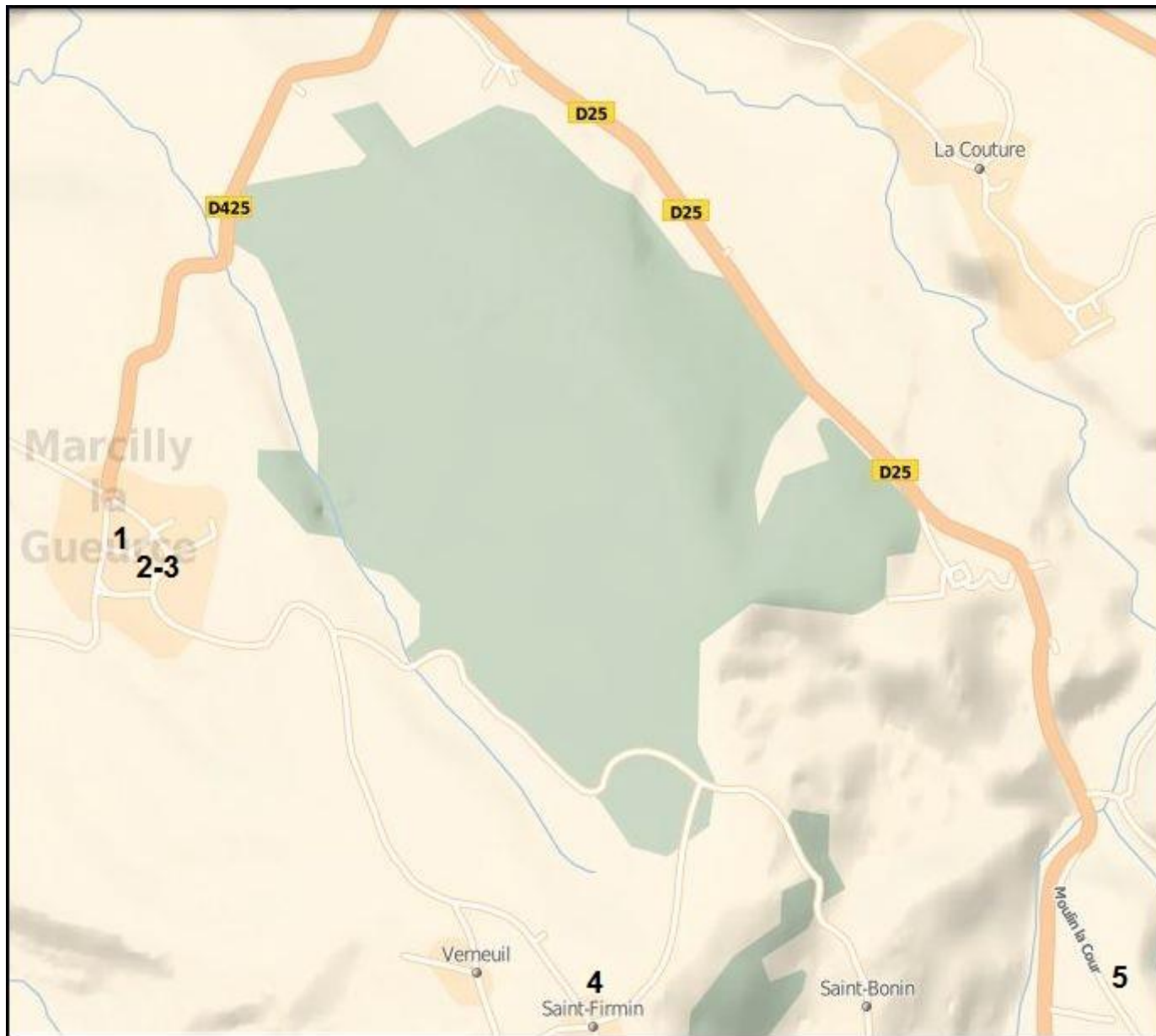
Croix de Marcilly-la-Gueurce