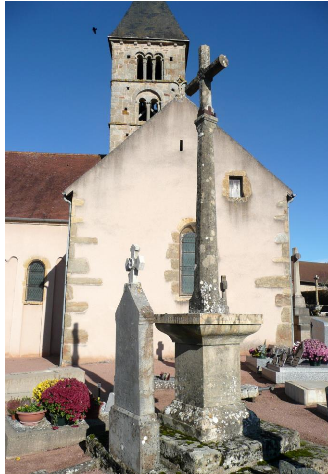
2. Croix située à l'entrée est du cimetière, qui entoure l'église Saint-Laurent de Marcilly-la-Gueurce.

On aperçoit le clocher de l'église romane du XIe-XIIe siècle dédiée à Saint-Laurent et que l'on peut visiter.