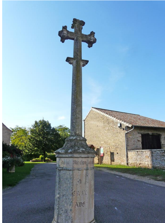
Devant le chevet de l'église à Préty

La croix est en pierre, de style néo-gothique, avec les fleurons sculptés de rosaces de feuillages découpées : un bouton proéminent entouré de 4 touffes de feuillages. Elle est sur une base qui simule une colline. En dessous, autour du sommet du socle octogonal se trouve l'inscription suivante :