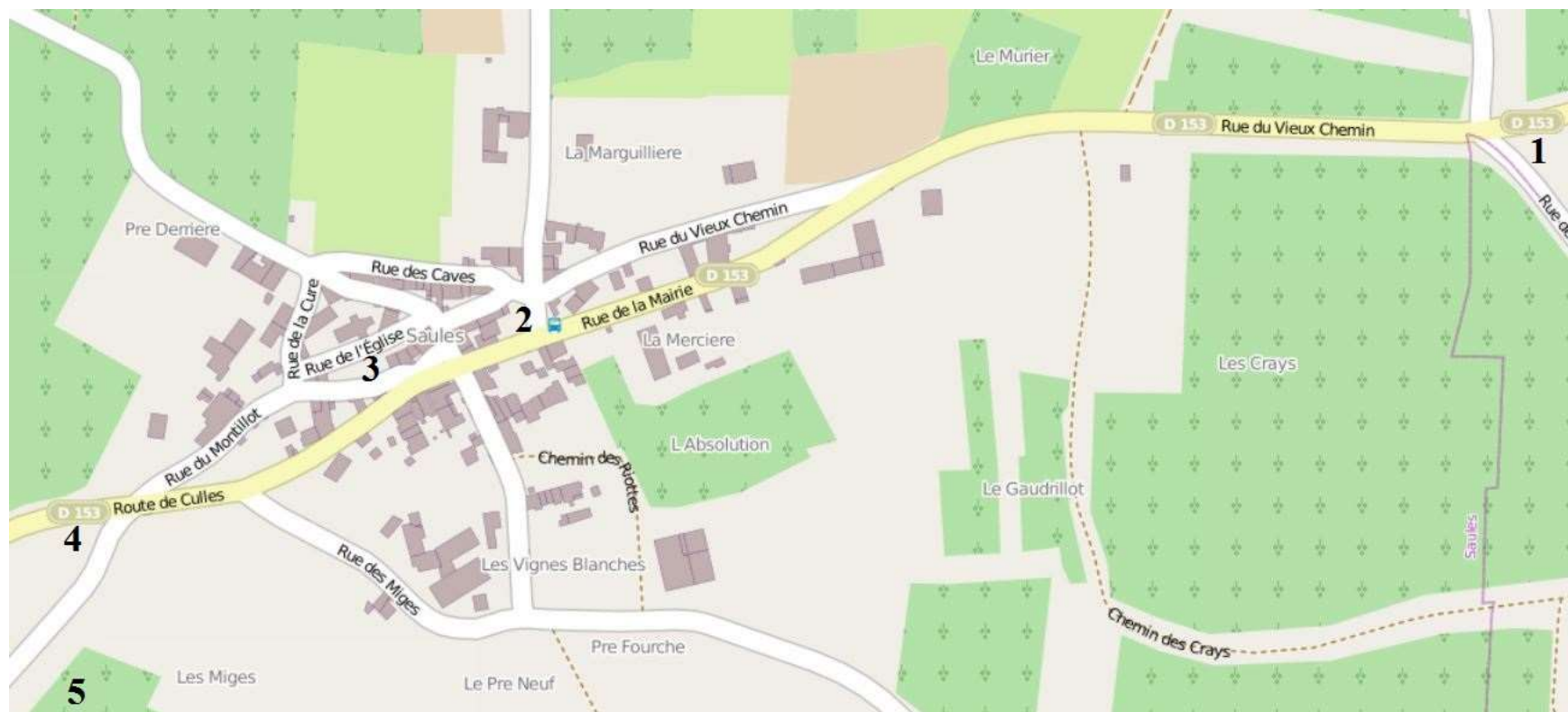
Les Croix de Saules, à partir de la D153 de Saint-Boil à Cullès-les-Roches (la croix 1 se trouve à l'extrémité de la rue des Quatre-Chemins)