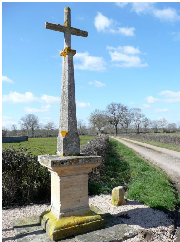
7. Croix des Petites Maisons à Vindecy : avant le bourg de Vindecy, prendre la petite route à droite, passer le hameau des Petites Maisons ; la croix est un peu plus loin, sans inscription.

Reprendre la D130 en sens inverse vers le bourg de Vindecy.