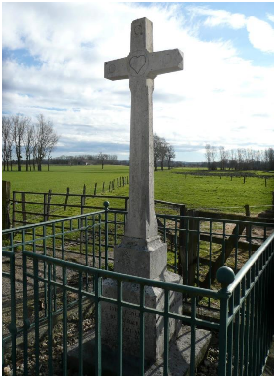
3. Croix d'Arcy (1894), au sud-est du bourg de Vindecy, près du château d'Arcy du XVe-XVIIe siècle.

Cette croix est ornée d'un cœur inscrit dans un cercle au croisillon. Trois cercles gravés au faite et aux extrémités des bras de la croix figurent la perfection et l'infini divins. Sur le piédestal, on lit des inscriptions gravées et peintes en rouge : devant « Indulgence de 40 jours Pater et Ave », à droite « Sur la terre d'Arcy Erigée le 25 septembre 1894 », à gauche « Après nos âmes Bénissez tous nos travaux ».