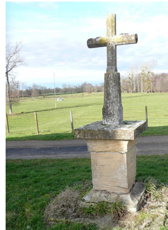
5. Croix de Fourneau (1867), au nord de Vindecy : en sortant du bourg, prendre la D130 vers la Loire, puis la première petite route à droite.

Sur le piédestal de cette croix sans ornement, on lit la date de 1862.