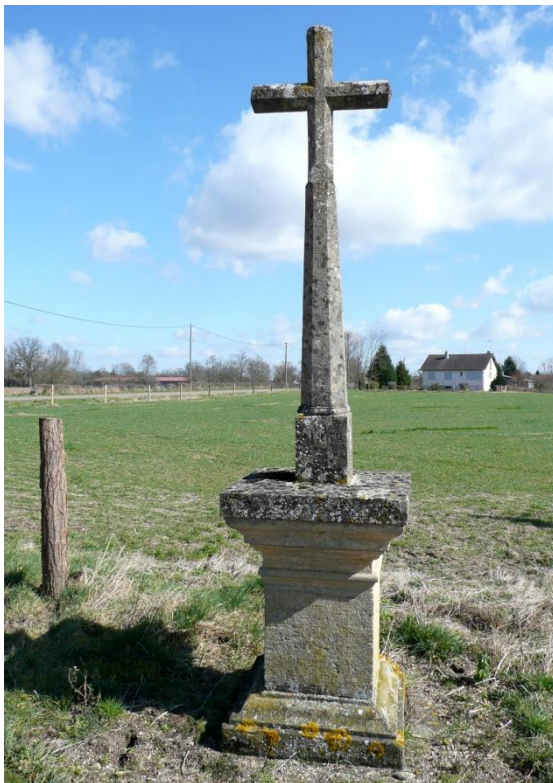
4. Croix des Justices (1862) à Vindecy, sur la D130 de Vindecy à Montceaux l'Etoile.

Cette croix est ornée d'un cœur inscrit dans un cercle au croisillon. Trois cercles gravés au faite et aux extrémités des bras de la croix figurent la perfection et l'infini divins. Sur le piédestal, on lit des inscriptions gravées et peintes en rouge : devant « Indulgence de 40 jours Pater et Ave », à droite « Sur la terre d'Arcy Erigée le 25 septembre 1894 », à gauche « Après nos âmes Bénissez tous nos travaux ».