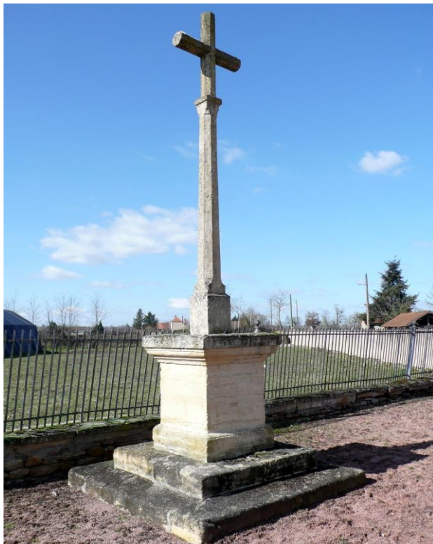
6. Croix de la sortie du bourg, sur la D130 en direction de la Loire.

Croix octogonale à écoinçons, sans ornement, érigée sur un emmarchement de deux degrés et un piédestal sans inscription à tablette débordante.