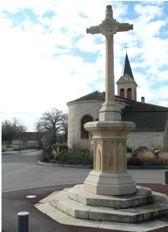
1. Croix de Mission O.M.I. (1865) de l'église Saint Martin, à Vindecy.