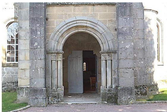
Portail à double voussure torique néo-romane

L'église Saint-Pierre d'Auxy a conservé de l'époque romane (XII e siècle) la partie centrale de la nef et le chœur ; ainsi l'église est inscrite au titre des Monuments Historiques depuis le 23 juillet 1976 « pour son chœur et sa nef ». L'église a été profondément modifiée au cours des siècles : une première restauration fut effectuée en 1685, d'autres auraient eu lieu dans les années 1780. En 1875, suite à l'effondrement du clocher fut érigée la tour rectangulaire accolée au mur de façade ; elle supporte l'actuel clocher-porche néo-roman, à trois étages de fenêtres en plein cintre. L'étage du beffroi est creusé de baies jumelles à colonne engagée. Une pyramide à quatre pans couronne le tout. La tribune date aussi du XIX e .