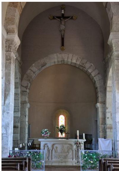
Chœur roman et autel décoré des Pèlerins d'Emmaüs