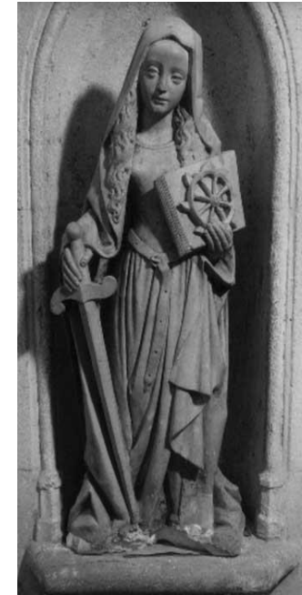
Statue de sainte Catherine d'Alexandrie, vierge et martyre du IV e siècle, avec les instruments de son supplice (roue, épée). Elle répondit avec succès aux objections des philosophes chargés de la convaincre de la stupidité du christianisme