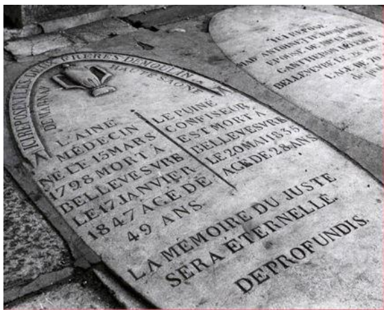
Dalles tombales sous le porche de l'église (1770, 1835, 1847)