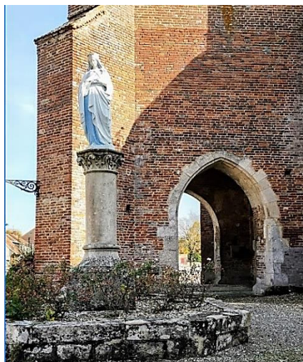
Statue sur piédestal de Marie Immaculée, à droite du porche de l'église, souvenir de la Mission de 1866

Or, la vie éternelle, c'est qu'ils te connaissent, toi le seul vrai Dieu, et celui que tu as envoyé, Jésus Christ. Jean 17, 3