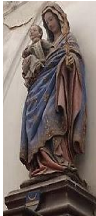
Statue, XVI e siècle, en pierre peinte de la Vierge à l'Enfant, de type slutérien, hanchée, tenant un sceptre. Draperie évasée aux pieds, plis riches. L'Enfant tient un phylactère : Ego dominus Deus verus (Moi, je suis le vrai Dieu)

L'église, dans le style ogival du XIII e , est voûtée de fines ogives dont les retombées s'opèrent sur des faisceaux de colonnettes, dans la nef, entre les grandes arcades en cintre brisé. Les bas-côtés sont voûtés d'arêtes. Nef et collatéraux sont éclairés par des fenêtres en plein cintre.