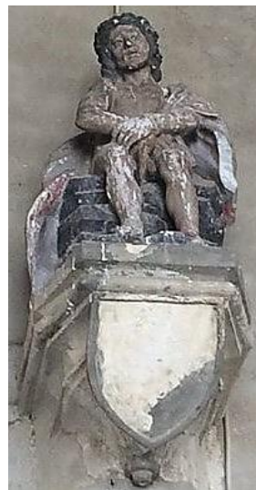
Statue du Christ-aux-Liens, XVI e siècle, classée MH en 1932, haut placée dans le croisillon gauche