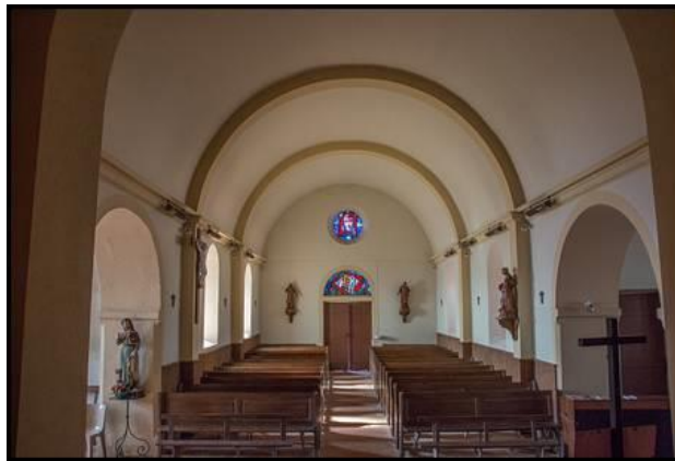
Porte d'entrée avec vitraux de frère Éric et statues de bois du XVIIIe des saints patrons