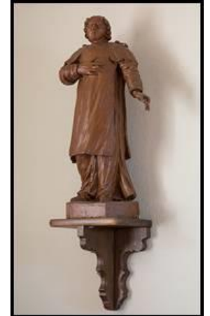
Statues XVIIIe Saints Gervais et Protais