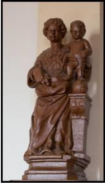
Statue de la Vierge à l'Enfant, debout sur le globe terrestre, XVIIIe

Les deux chapelles latérales, ornées de statues sulpiciennes, forment transept.