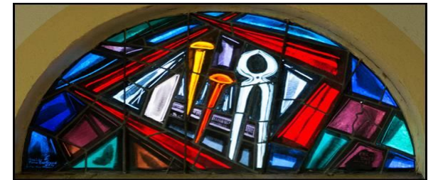
Vitrail des instruments de la Passion