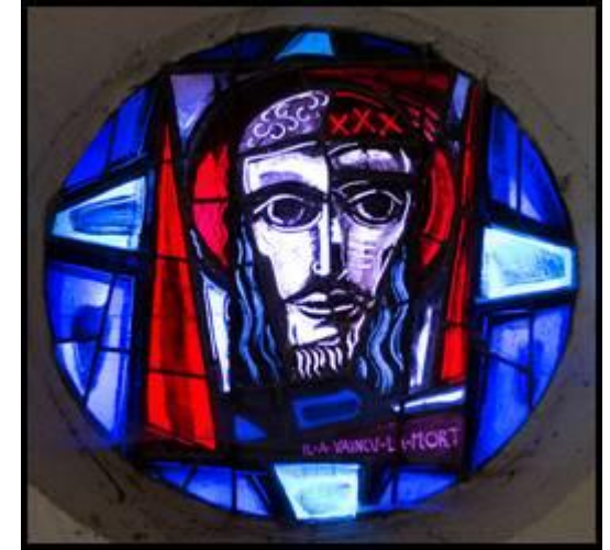
Vitrail du Christ de la Passion : Il a vaincu la mort