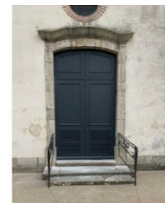
Porte à persiennes installée en 2022 pour aérer l'église

occupée par une statue de Saint-Rémy, évêque, qui s'appuie sur un bandeau de 2 rangs de dents d'engrenage.