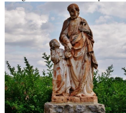
Statue de Saint-Joseph et l'Enfant-Jésus, à droite de l'église