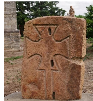
Stèle gravée d'une croix sur le parvis de l'église

A l'extérieur, le clocher-porche flanque la nef, épaulée latéralement par des contreforts à pinacles.