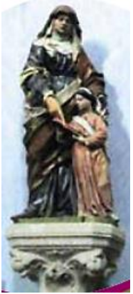
Education de Marie par sainte Anne, statue du XVIIIe à la draperie baroque, au-dessus de la tribune vers la nef

Confessionnal au fond du transept sud, bois peint de style Louis XV, meuble à fronton et pots de feu