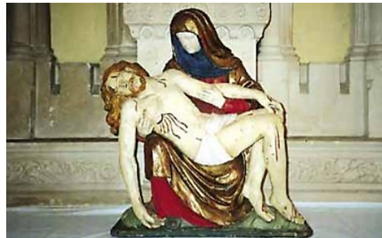
Pietà en bois peint

Elle comporte une nef de trois travées, un transept saillant, une abside semi-circulaire. Les retombées des ogives portent sur des pilastres cannelés arrêtés sur console dans la nef et sur des colonnettes dans la croisée. Le mur latéral nord a été décapé lors de la réfection des peintures intérieures (style Michel Bouillot : paille, citron, gris).