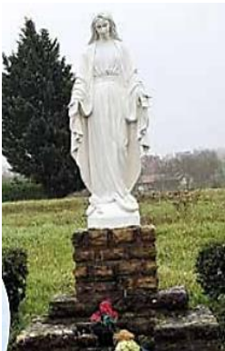
Statue de la Vierge Marie de Voite dans un enclos oratoire

A l'extérieur, clocher-porche au-dessus d'une façade largement décorée dans le style XIXe. L'église est entourée de son cimetière. Croix de carrefour et de chemin.