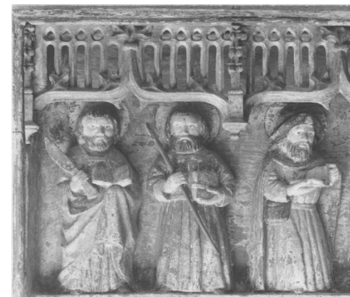
St Barthélémy (couteau), st Thomas (lance), st Jacques le Majeur (coquille)