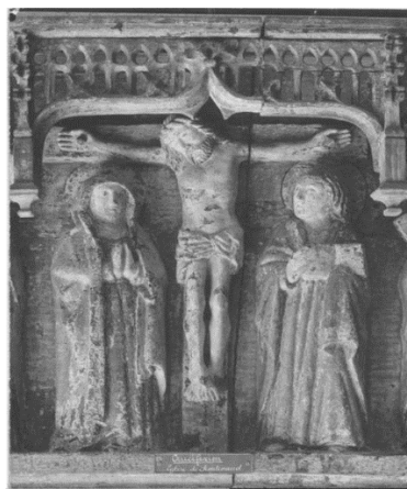
Christ en croix entouré de la Vierge et de st Jean

Au-dessus de la porte de sacristie, du côté nord, se trouve un retable , classé à deux reprises en 1948 et en 1959, de la première moitié du XVI e siècle. C'est un bas-relief allongé, de 2,05 m, sculpté au centre du Christ en croix, entouré de la Vierge, de saint Jean et des 12 apôtres avec leurs attributs et un livre. Les personnages sont groupés deux par deux, sous des claustras de type flamboyant. Le bois est sculpté et peint, avec des traces de dorures.