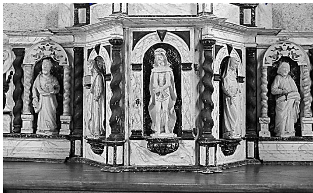
Tabernacle du XVII e siècle provenant de l'ancienne église, classé en 1980