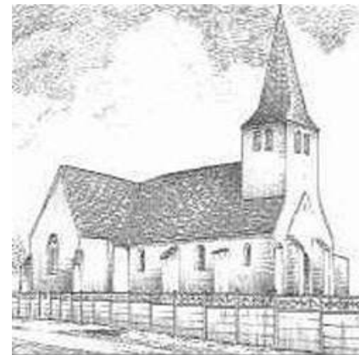
Dessin Yves Ducourtioux