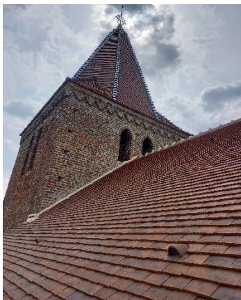
Clocher et toiture, rénovés en 2022

Le clocher, seule partie subsistant de l'église antérieure à 1879, comporte un étage de beffroi, éclairé sur chaque face par deux fenêtres en cintre brisé, que surmonte un cordon dessinant un motif triangulaire. La façade, ornée d'une rosace, est moderne. En 2021-2022, les travaux de réfection du toit du clocher et du chœur de l'église ont été suivis par ceux de la nef et de la sacristie, et par les terrassements et gouttières pour évacuer les eaux de pluie. Une souscription avait été lancée en 2021 par la mairie à la Fondation du patrimoine pour financer une partie des travaux de sauvegarde de l'église.