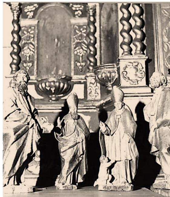
Au-dessus de ce tabernacle, statue baroque de la Vierge à l'Enfant, XVIIIe, bois polychrome.