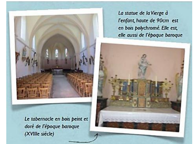
La statue de la Vierge à l'enfant, haute de 90cm est en bois polychromé. Elle est, elle aussi de l'époque baroque