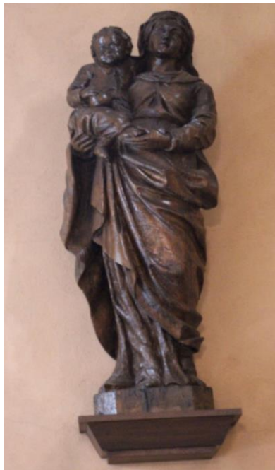
Vierge à l'Enfant portant le globe terrestre, bois sculpté, XVIIe

Paul, le curé d'Ars, sainte Thérèse de l'Enfant-Jésus.