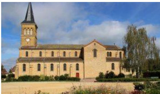
Presbytère néo-gothique, à gauche de l'église, à lucarne médiane.

Le linteau de la porte latérale est sculpté en méplat de motifs spirés et opposés, où se déploient des fleurons à cinq pétales. Ce monolithe de calcaire ocre gréseux serait un motif roman du XII e siècle.