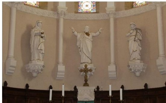
Statues du chœur : Allégories de la Foi (calice) et de l'Espérance (ancrage) entourant la Charité

Les sacristies construites autour du chœur ressemblent à un déambulatoire.