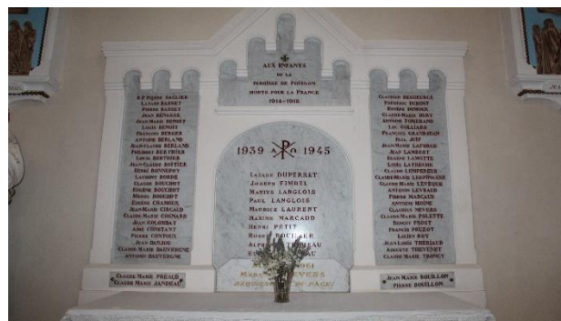
Monument funéraire 1939-1945