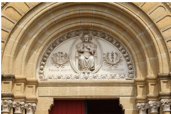
Christ en Gloire et inscription latine Pastor bonus ostium ovium (Je suis) le Bon Pasteur La Porte des brebis

Le chrisme du tympan, monogramme du Christ, est formé des deux lettres grecques X ( khi ) et P ( rhô ), deux premières lettres du mot \chi\rho\iota\sigma\tau\acute{o}\varsigma (« Christ ») ; l'usage de cette graphie est associée au premier empereur romain chrétien Constantin I er .