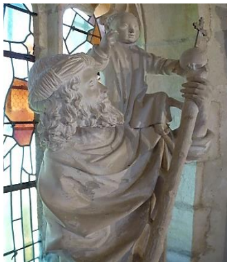
Statue de Saint Christophe, en pierre, XVe, inscrite MH en 1979

Le Christ en Croix est un tableau de la nef. Huile sur toile du XIXe siècle, d'après une gravure exécutée par Philibert l'Aîné, d'après une gravure de Girardon. Tableau restauré en 2018-2019, classé MH en 2017.