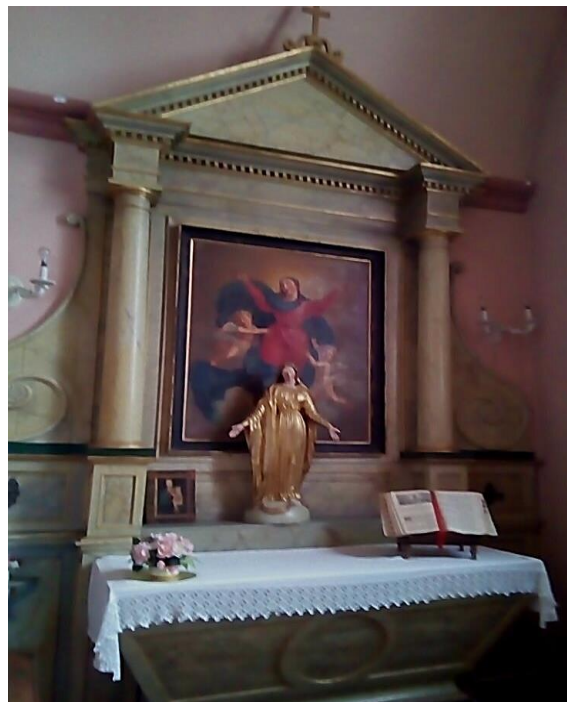
L'Assomption , tableau de Piguet de St Genis

Laval, orne le retable de la chapelle latérale droite . Statue de bois doré de Notre-Dame, XIX e .