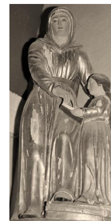
Sainte Anne instruisant la Sainte Vierge, bois doré, XIXe siècle

Le clocher, au-dessus de la croisée du transept, de plan carré, est constitué de deux étages encadrés de bandes lombardes. Sous la flèche en pierre, une corniche saillante est décorée de modillons et de dents d'engrenage.