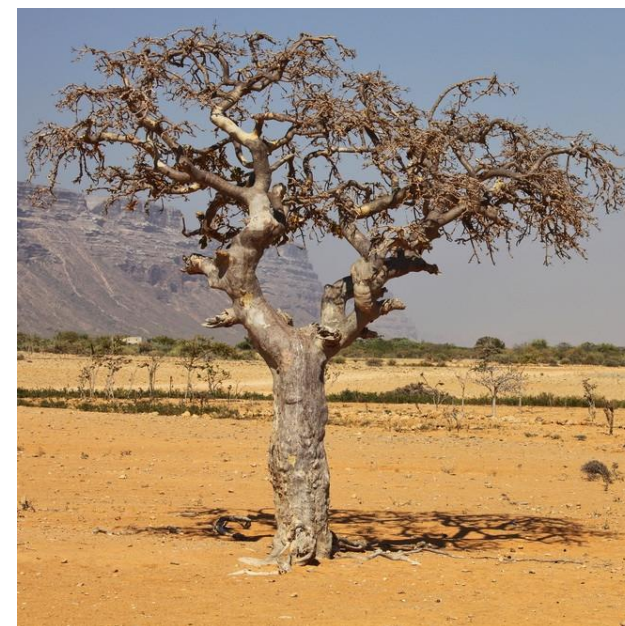
ARBRE À MYRRHE