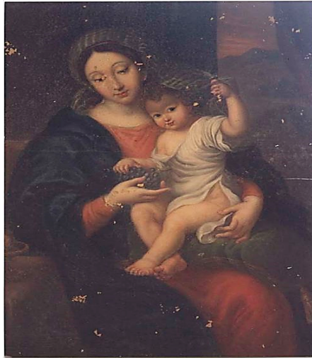
Copie de la Vierge à la grappe de Mignard