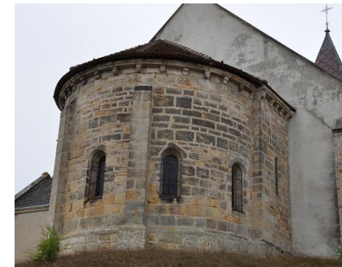
Chevet roman et contreforts à talus