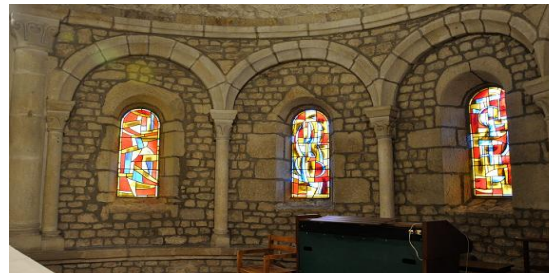
Abside ornée d'arcatures sur colonnettes