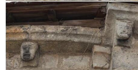
Modillons extérieurs sculptés de têtes