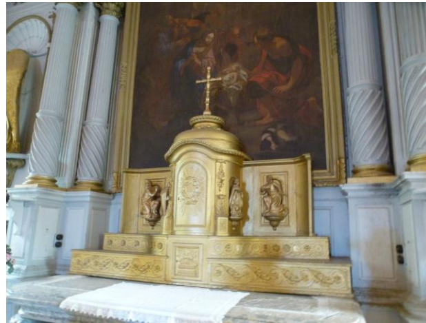
Tabernacle en bois doré et tableau de la Nativité