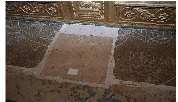
Le chœur ouvre sur deux chapelles par une arcade en cintre brisé. Dans la chapelle sud, voûtée d'arêtes, retable du XVIIe en bois doré à colonnes torsées et 5 statues anciennes (st Pierre, st Jean-Baptiste, la Vierge), classé MH en 1952.