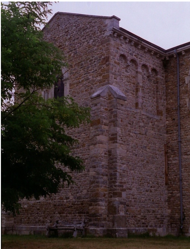
Arcatures lombardes du transept

Moi, je suis le bon pasteur ; je connais mes brebis, et mes brebis me connaissent, comme le Père me connaît, et que je connais le Père ; et je donne ma vie pour mes brebis. J'ai encore d'autres brebis, qui ne sont pas de cet enclos : celles-là aussi, il faut que je les conduise. Elles écouteront ma voix : il y aura un seul troupeau et un seul pasteur. Jean 10, 14-16