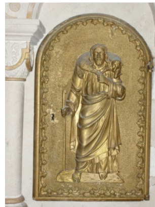
Tabernacle orné du Bon Pasteur